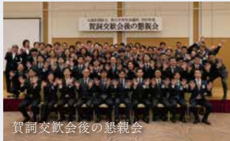
賀詞交歓会後の懇親会

賀詞交歓会では、年間スローガンの発表や、理事長による1年間の所信表明を行います。