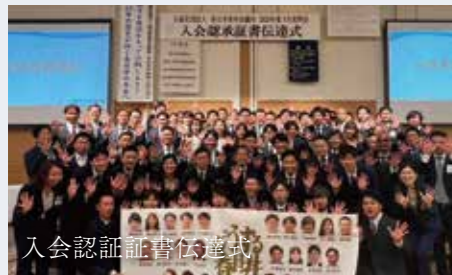
入会認証証書伝達式

THE FIRST BASKE 3×3 ～きみのシュートが導く明るい未来のゴール～ バスケットボール競技を通じて、子ども達に身近な社会課題解決へ向けた行動のきっかけづくりと、地域全体でのSDGs達成への取り組みを促しました。