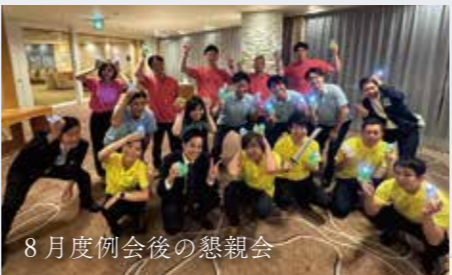
8月度例会後の懇親会

ダイバーシティキャンプ～輝く個性広がる可能性～として、春日井市の小学生50人をお招きして多治見市の地球村にて学びの多いキャンプを開催しました。