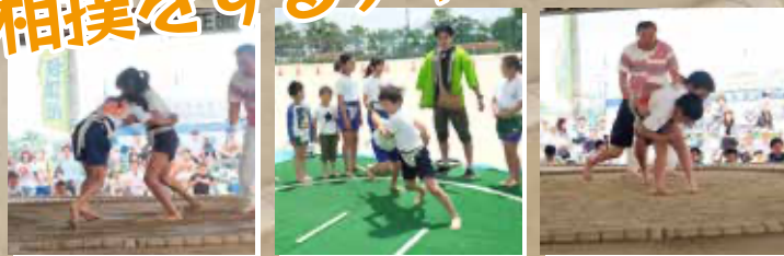
※写真は2019年開催の様子です。 ※一部予選と決勝トーナメントを本土俵にて行います。

春日井市及び周辺地域の小学生 (瀬戸市・小牧市・尾張旭市・岩倉市・北名古屋市等)