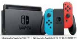
Nintendo Switchのロゴ・Nintendo Switchは任天堂の商標です。